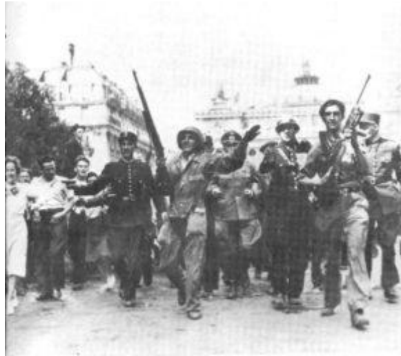
El general Von Choltitz es conducido por los españoles, tras su detención, al Ayuntamiento de París

“La Nueve” prosiguió el avance en dirección a Alemania y tuvo la oportunidad, el 5 de mayo de 1945, de hacer su entrada en el Nido del Aguila de Hitler, en Berchtesgaden. Al final de la guerra, de los 144 hombres de “La Nueve” que desembarcaron en Normandía, sólo quedaban 16; de las bajas, 95 eran españoles