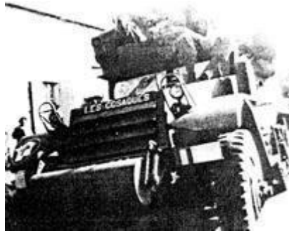
El vehículo de Granell