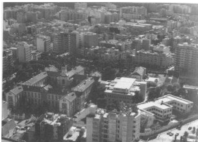
Vista aérea del Hospital Provincial

En el mes de Julio de 1936, la provincia de Castellón tenía un censo de unos 308.000 habitantes, de los cuales 40.820 eran vecinos de la capital. Para la asistencia hospitalaria de esta población sólo estaba el Hospital Provincial (dependiente de la Diputación Provincial), que atendía toda la patología médica y quirúrgica, así como la asistencia psiquiátrica de la provincia. Cuando la gravedad o la especialización de la enfermedad lo requería (neurocirugía, enfermedades infecciosas, dementes peligrosos, etc.), los pacientes eran trasladados a centros especializados de otras provincias, sufragando los gastos la Diputación.