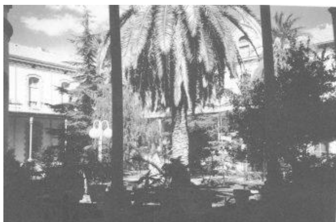
Patio interior del Hospital