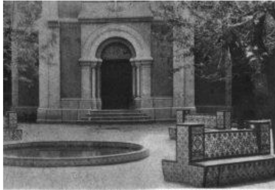
45. Fachada de la iglesia en el patio central del Hospital de Castellón.